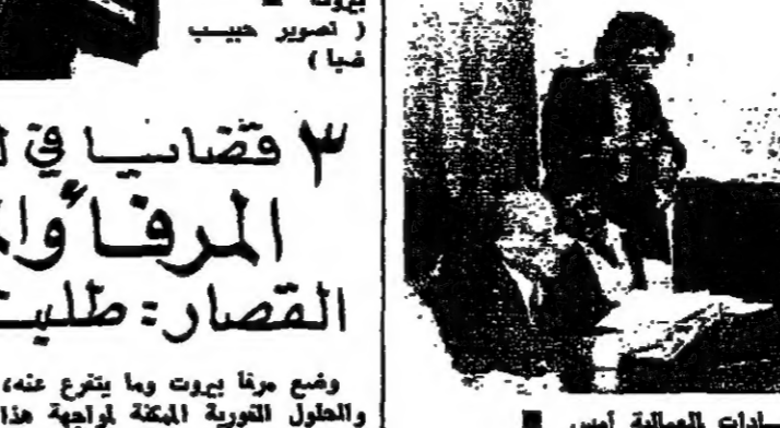
اجتماع الاتحادات العمالية امس

نقش مذكور من مخم الاتحادات العمالية ، في اجناع عقوده امس في النقابية القوية المطروحة ، وفي راسها نقابية الاتحادات العمالية . ولم يود التقاضي الى اتفاق ، فقرر المودالي اجناع يوم الاثنين المقبل .